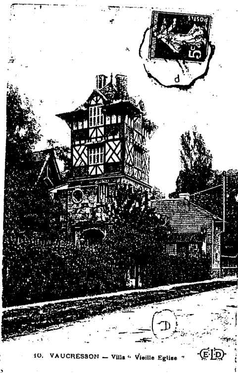
10. VAUCRESSON — Villa « Vieille Eglise »

Le 5 mai 1884 la ligne de chemin de fer de Paris à l'Etang la Ville fut mise en service et desservit la gare de Vaucresson. A partir de cette époque, le lotissement devint un quartier important avec l'édification de nombreuses villas, occupées de façon temporaire en été, puis en raison de la crise des logements, née de la guerre de 1914-18 et de l'amélioration des moyens de transports, transformées en résidence principale.