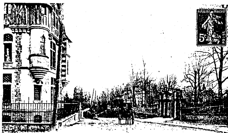
Vaucresson. - Route départementale

Pour se rendre de Paris à Vaucresson, il fallait disposer d'un équipage, venir à cheval ou emprunter une diligence à chevaux qui s'arrêtait au carrefour du Fer Rouge, à l'angle du boulevard de la République et du boulevard de Jardy.